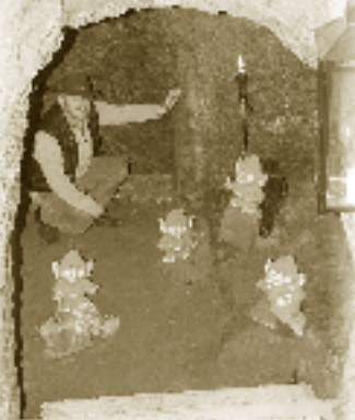
Blick in den Gewölbekeller