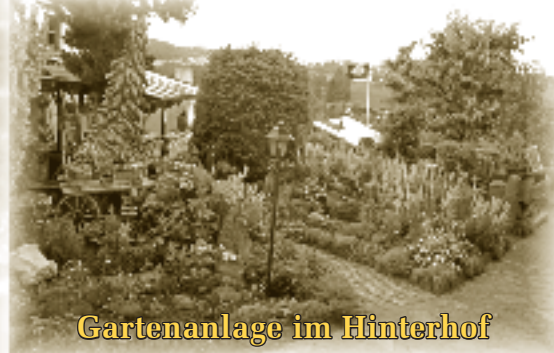
Gartenanlage im Hinterhof