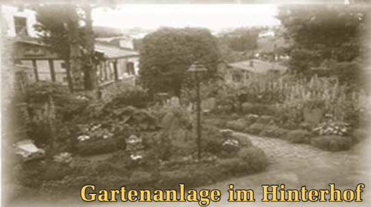
Gartenanlage im Hinterhof