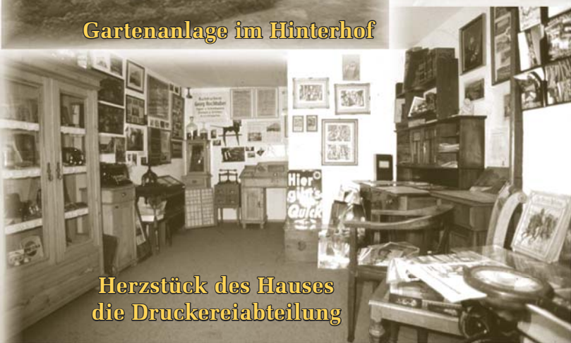
Herzstück des Hauses die Druckereiabteilung