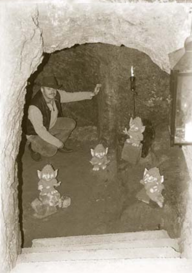
Blick in den Gewölbekeller