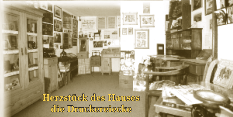
Herzstück des Hauses die Druckereiecke